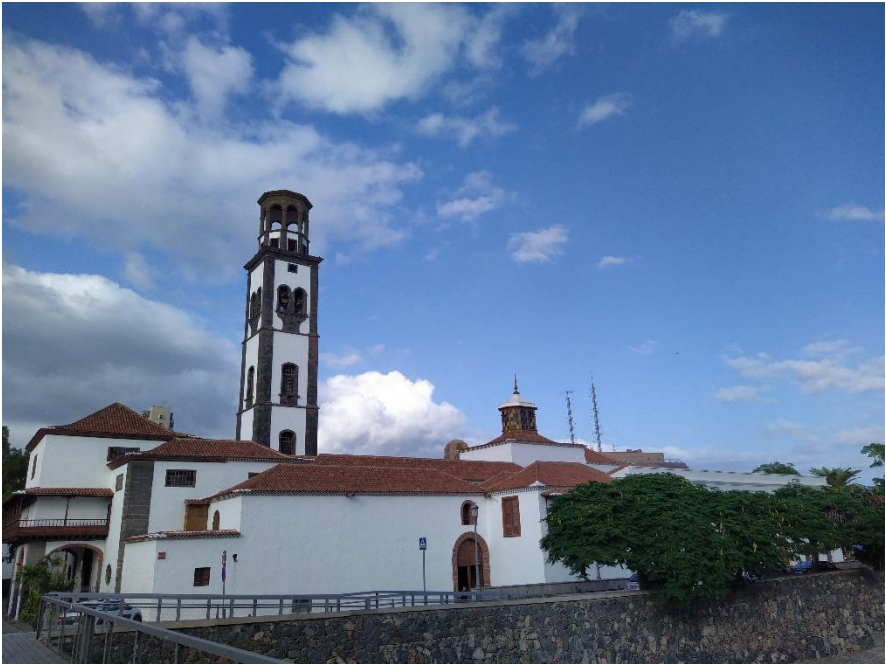
Kirche und Kirchplatz in St.Cruz de Tenerife